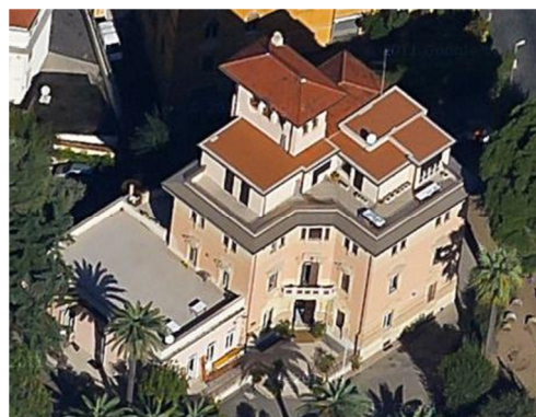
Abb.4: Botschaftskanzlei in Rom