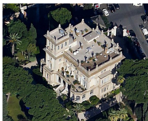
Abb.2: Schweizerisches Kulturzentrum in Rom