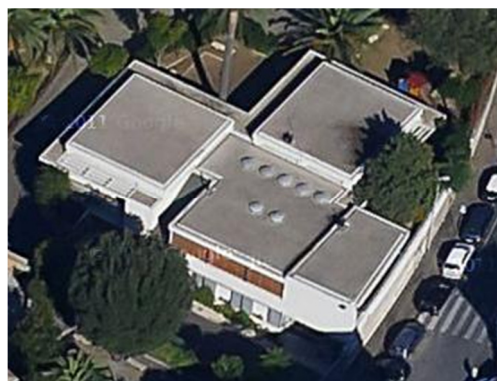
Abb.3: Residenz in Rom